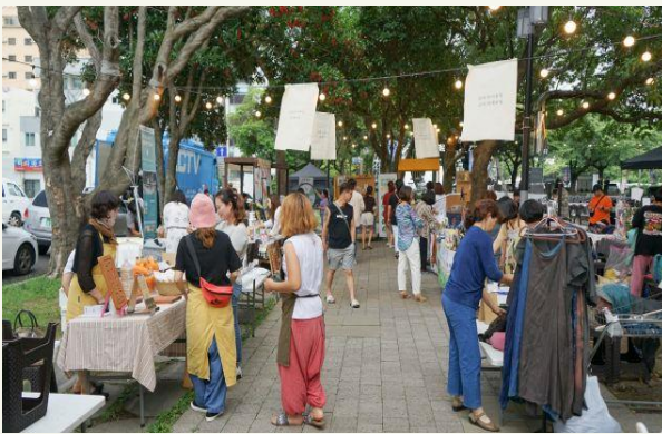
판로 및 유통채널 확대