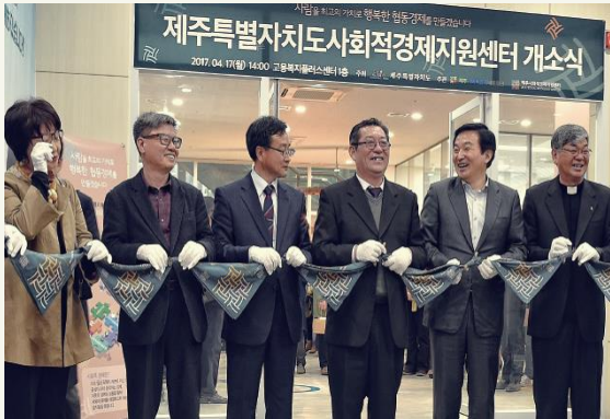
사회적경제기본조례 의거, 설립(2017)