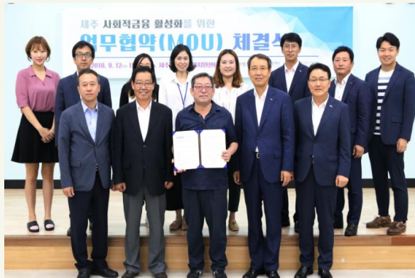
사회적경제 생태계 조성