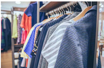
함께하는 그날 협동조합