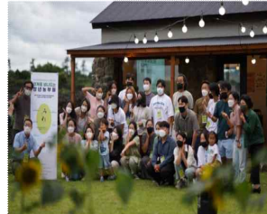
프로젝트 그룹 짓다